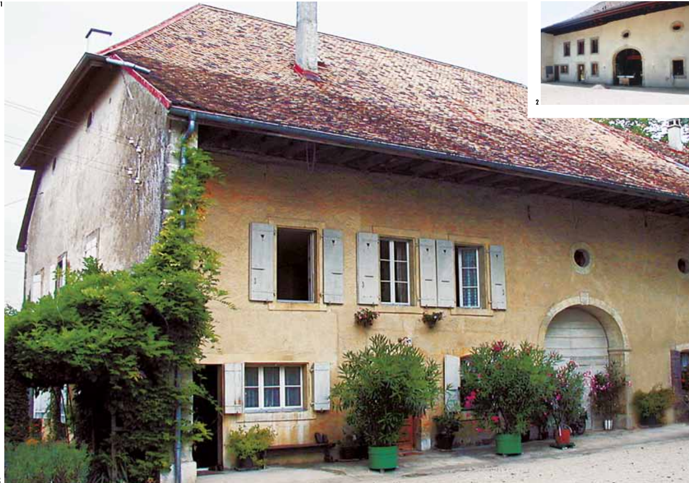
1 Façade avant transformations.